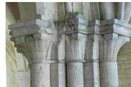
Chapiteaux avec motif de feuille d'eau, abbaye de Noirlac (Cher).