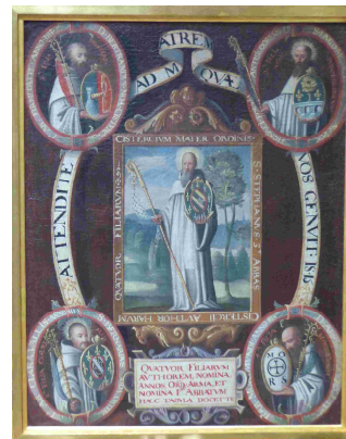
Etienne Harding entouré des quatre abbayes qu'il a fondées ; huile sur toile, anonyme XV e s., abbaye de Cîteaux.

La petite communauté de Cîteaux, désormais dirigée par Albéric, se remet difficilement de ce départ. Le travail ne manque pas : construction, défrichage, mise en valeur des terres, copie des manuscrits nécessaires à la vie liturgique et spirituelle. Quelques vocations se présentent, mais elles sont vite découragées sans doute par l'austérité de la vie à Cîteaux. C'est dans ce contexte difficile que meurt Albéric (1108) et qu'Etienne devient abbé. Selon la tradition, l'arrivée de Bernard de Fontaine, avec trente compagnons, redonne courage à la communauté et permet d'envisager des fondations : La Ferté (1113), Pontigny (1114), Clairvaux (1115) et Morimond (1117).